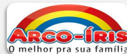
Supermercado Arco Íris