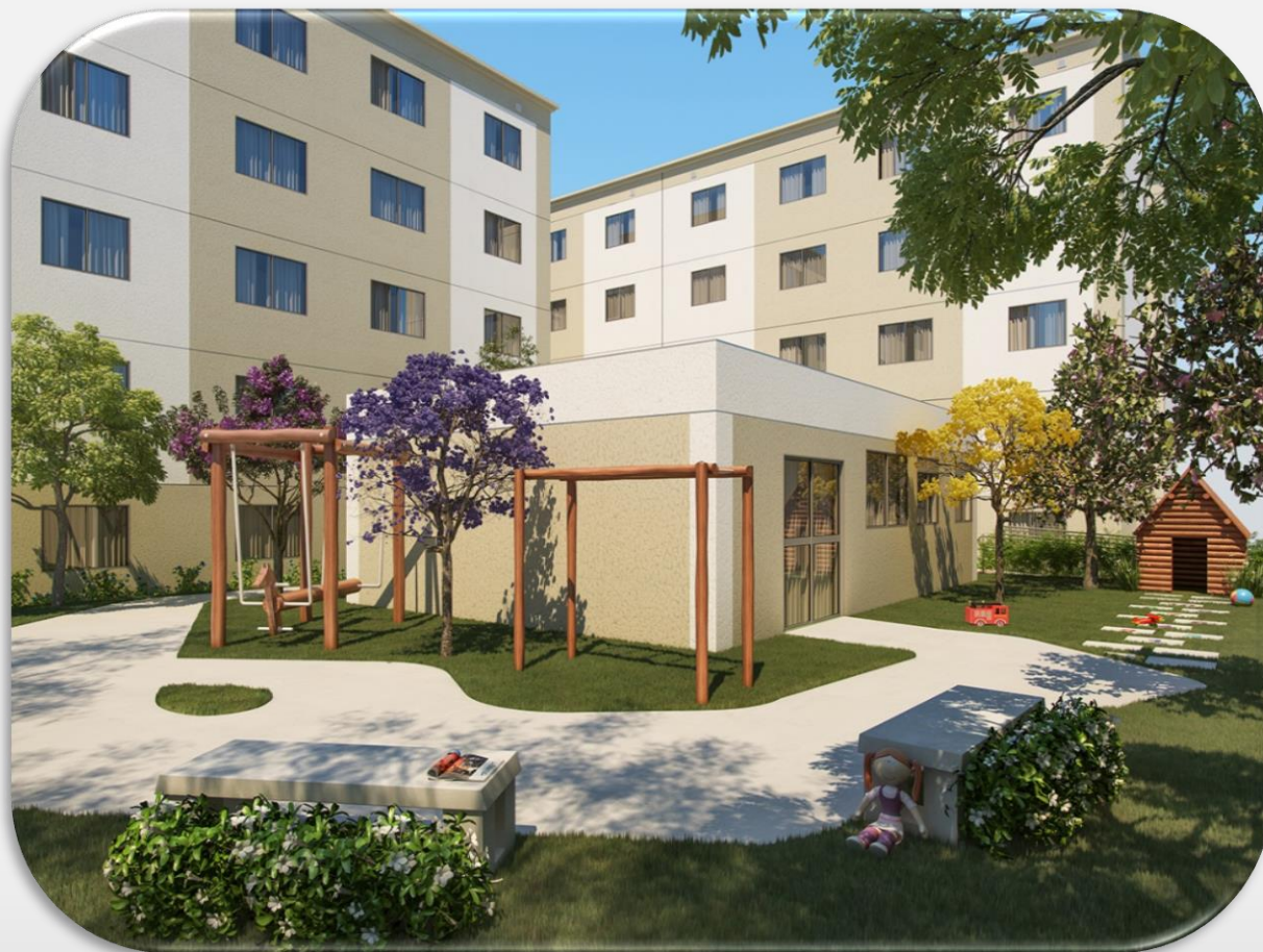
Ilustração artística: “Os acessórios de produção são meramente ilustrativos e não fazem parte do contrato de aquisição. A vegetação que aparece nas imagens está em porte adulto. O porte da vegetação será atingido após alguns anos da entrega do empreendimento. “