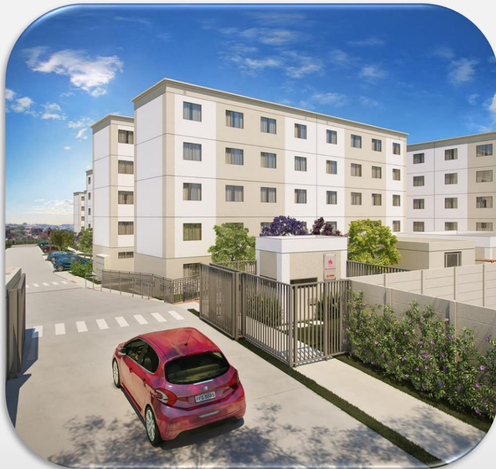
Ilustração artística: “Os acessórios de produção são meramente ilustrativos e não fazem parte do contrato de aquisição. A vegetação que aparece nas imagens está em porte adulto. O porte da vegetação será atingido após alguns anos da entrega do empreendimento. “