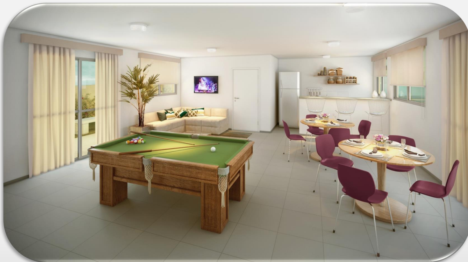
Ilustração artística. “Os acessórios de produção, móveis, revestimentos de piso e parede, forros, luminárias, painéis, armários e equipamentos são meramente ilustrativos e não fazem parte do contrato de aquisição. O detalhamento dos serviços, equipamentos e acabamentos que farão parte deste empreendimento consta no memorial descritivo, na convenção de condomínio e no compromisso de compra e venda. “