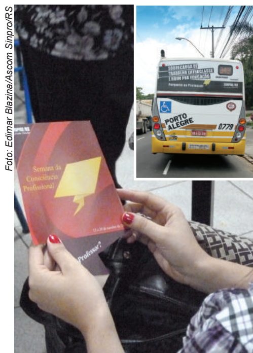
Fólder e busdoor da Semana da Consciência Profissional

e despotencializam a sua vida profissional e pessoal.